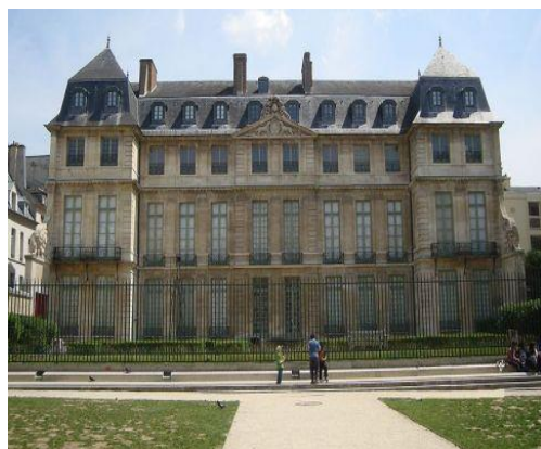
façade de l'hôtel Salé sur jardin