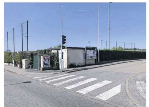
Sécriser l'accès piéton pour aller au COSEC à partir de la rue Alexandre-Turpault est l'un des projets retenus de cette première édition du budget participatif de Bois-d'Arcy.

Il s'agit de la réalisation d'une cabane à livre pour 3 000 €, de la création d'une promenade douce au nord de la Ville pour 60 000 €, d'un parc canin pour 52 000 €, d'espace de sport et de musculation en accès libre pour 30 000 €, de promenade urbaine autour de l'étang Per-